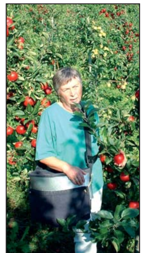
Driv stort i frukt på Blakset