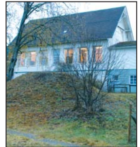
Riksantikvaren til Vereide