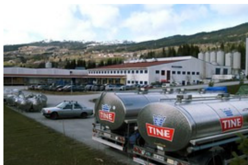
Anlegget på Byrkjelo er eit flaggskip i Tine.