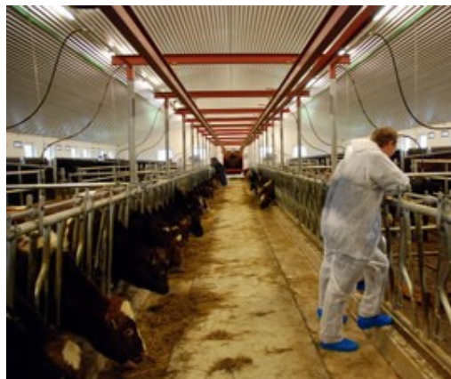
Kalvefjøsset rommar på det meste 160 dyr, som blir fora fram til ei slaktevekt på om lag 300 kilo.

http://www.firdatidend.no/nyhet.cfm?nyhetid=3843