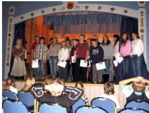
Eggenipa 4H vart kåra til Årets 4H-klubb i Sogn og Fjordane. Her frå haustfesten.

*Stand på Sandanedagane i lag med Gloppen 4H-nemnd