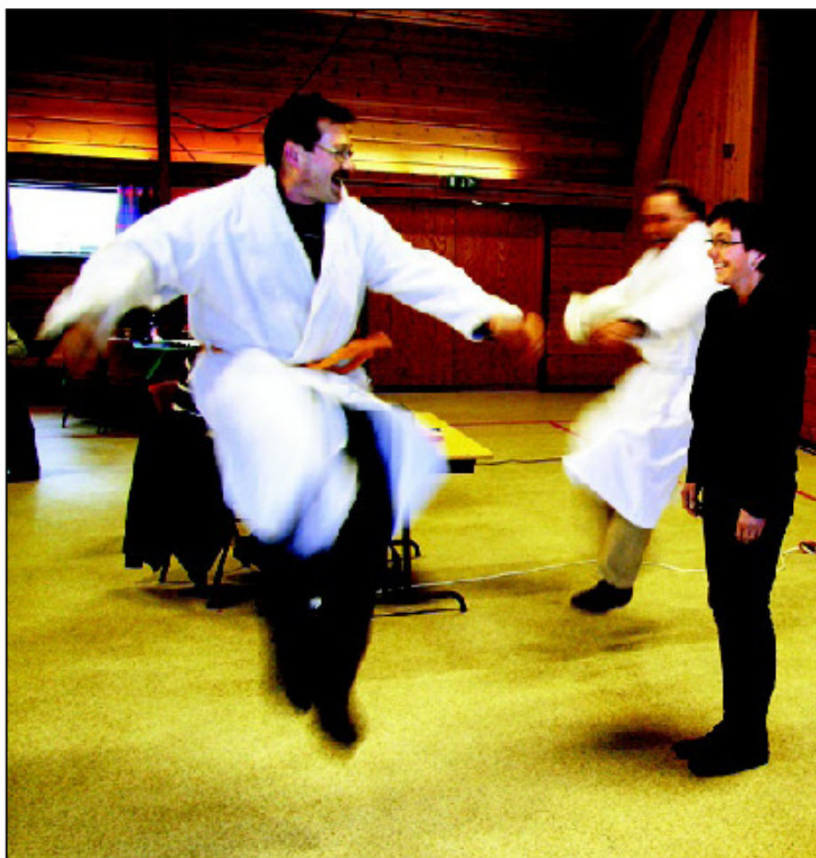
OVERSIKTSBILDE: Gjennom dans og sang overlevte Breimsbygda Dusi & Shampoo Quartet julekvelden i statsråd Heidi Grande Røys.